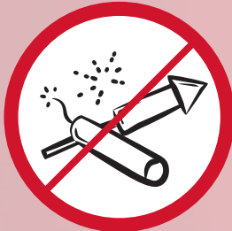
Feuerwerkskörper, Leuchtkegeln, Raumpulver, pyrotechnische Gegenstände / pyrotechnics