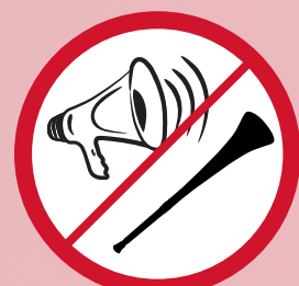
Mechanische oder elektronische Lärminstrument (Tröten, Druckluftpumpen) / mechanical or electronical devices such as megaphones