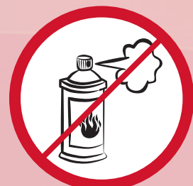
Gassprühdosen / aerosol spraya