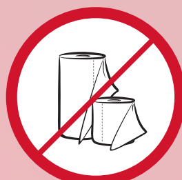
Papierrollen / paper rolls