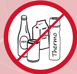
Flaschen aller Art, Becher, Dosen, etc. / glassware and bottles