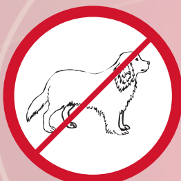
Tiere / animals