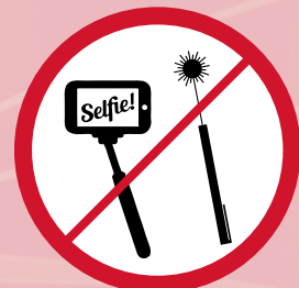
Laserpointer u. Selfie Stick / laserpointer and selfi stick