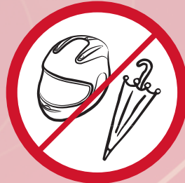
Schirme, Helme / umbrellas, helmets