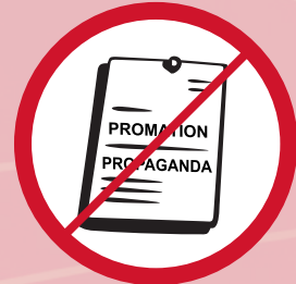
Rassistisches, fremdenfeindliches, rechtsradikales, nationalsozialistisches, sexistisches, homophobes oder politisches Propagandamaterial und Werbematerial / promotional materials