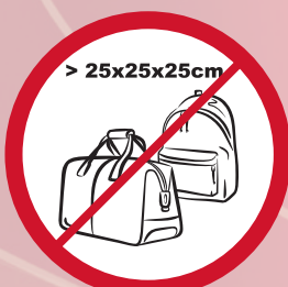
Sperrige Gegenstände, (z.B. Taschen, Rucksack) usw > 25x25x25 cm / eg. unwidely items, large bags, etc. > 25x25x25 cm