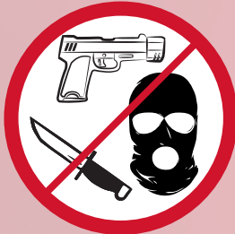
Waffen, gefährliche Gegenstände und Sturmhauben / firearms, weapons, balaclavas