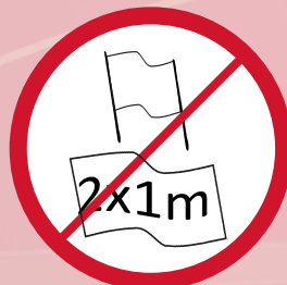
Doppelhalter jeglicher Art und Fahnen/Transparente die eine Größe von 200x100 cm überschreiten / banners with two poles, banners and flags max. 200x100