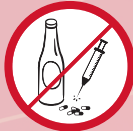
Alkoholische Getränke, Drogen / alcohol drinks, drugs